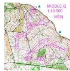
Középtáv selejtező, férfi pálya

A programot szerdán, a tereppel való megismerkedés jegyében, egy váltott vezetéses edzés nyitotta meg, melyen a magyar résztvevők száma még elég visszafogott volt, hiszen a többség csak este utazott le. Csütörtökön, amikor a VB középtávú programját modellezte a mezőny, már több volt a magyar a rajtlistában, de ettől még továbbra is leginkább a csehek uralták a terepet. A minél tökéletesebb szimulálás érdekében, itt is, akárcsak a VB-n, három csoportba osztották a mezőnyt, a különböző csoportokba besorolt futók pedig egyszerre rajtoltak, egymáséhoz nagyon hasonló, gyakorlatilag farsta kombinációt alkalmazó pályákon. A kiváló láthatósággal rendelkező terepen ez a körülmény jócskán emelte a hibázások lehetőségét, hiszen nem volt egyszerű elfeledkezni a látómezőben „össze-vissza” futkározó ellenfelekről. A döntőket meglehetősen szűkre szabták a cseh edzők, hiszen minden csoportból csak a legjobb három, a lányoknál pedig csak az első kettő juthatott tovább.