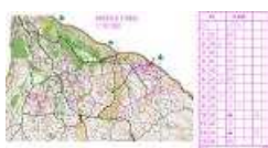
Középtáv döntő, női pálya