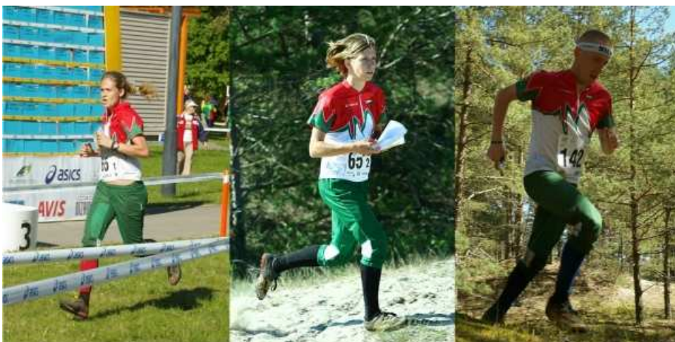
Magyarok a váltó versenyen