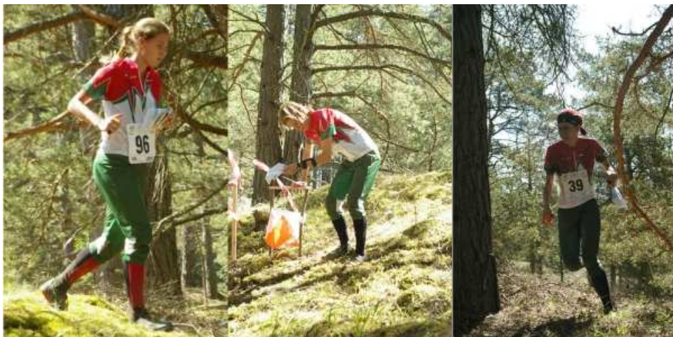
bónusz kép 1: magyar lányok a középtávon

Eredmények, győztes útvonalak, képek és sok minden egyéb elérhető az EB honlapján .