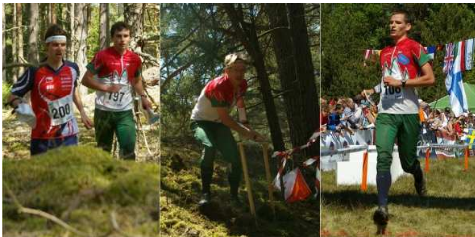
bónusz kép 2: magyar fiúk a középtávon